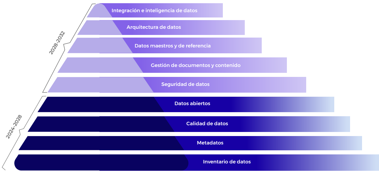
Ilustración 4. Líneas de acción por fase estratégica

Estas dos fases representan un compromiso sólido con la gobernanza de datos a largo plazo y respaldan la visión de utilizar los datos como un activo estratégico fundamental para el éxito de los planes, programas, proyectos y servicios municipales.