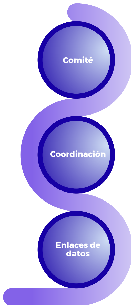
Ilustración 3. Roles para la gobernanza de datos

Cada una de las dependencias y empresas municipales, nombrará a un representante que tendrá el rol de enlace entre la dependencia o empresa municipal y la Coordinación.