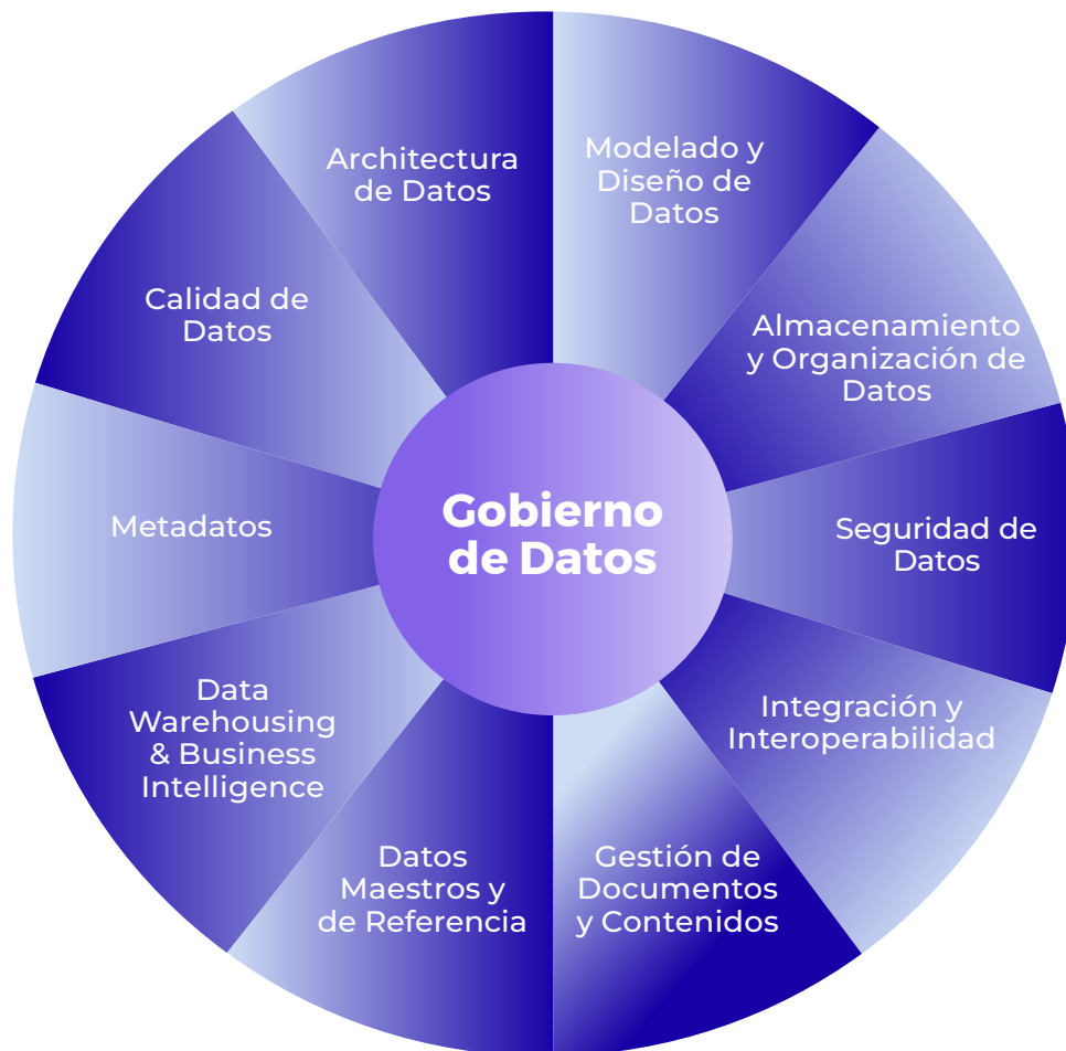
Ilustración 1. Componentes DAMA -DMBOK

La metodología de DAMA-DMBOK pone al centro la gobernanza de datos y alrededor los temas relacionados con la gestión de datos, que se refiere a la parte más operacional o de implementación para lograr la gobernanza de datos. (Datos.gob.es, 2021) (DAMA International, 2009).