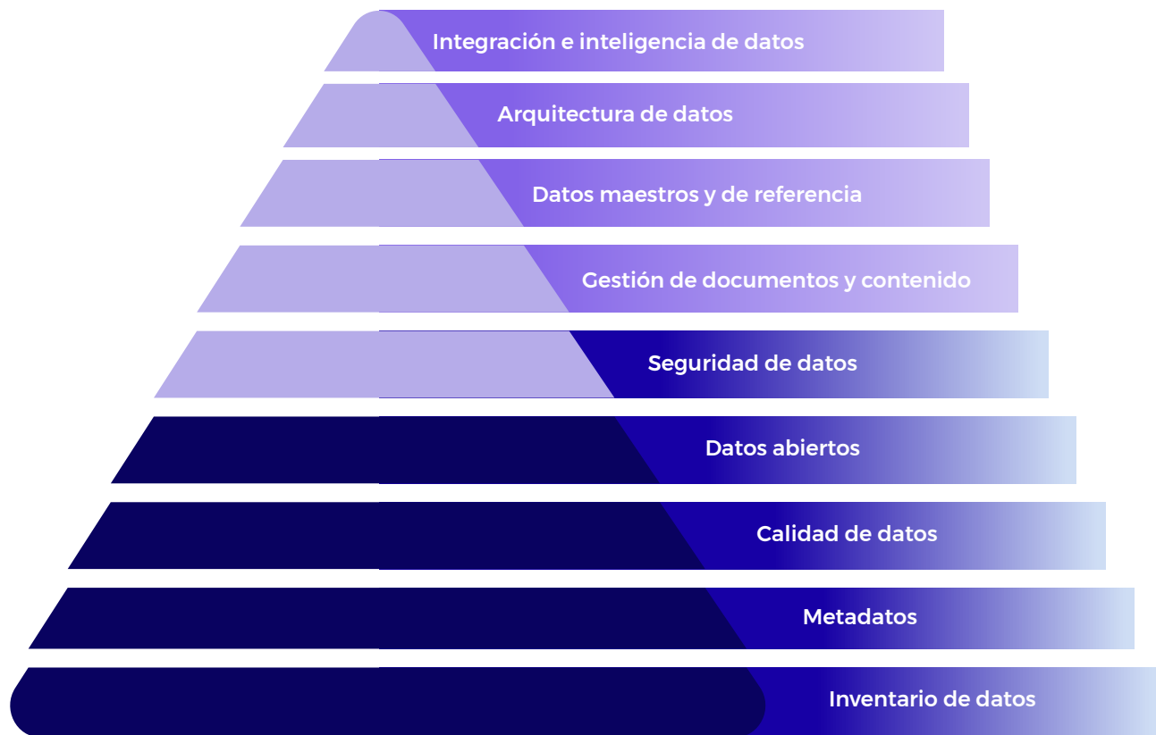
Ilustración 2. Líneas de acción de la Política Municipal de Gobernanza de Datos 2024-2032